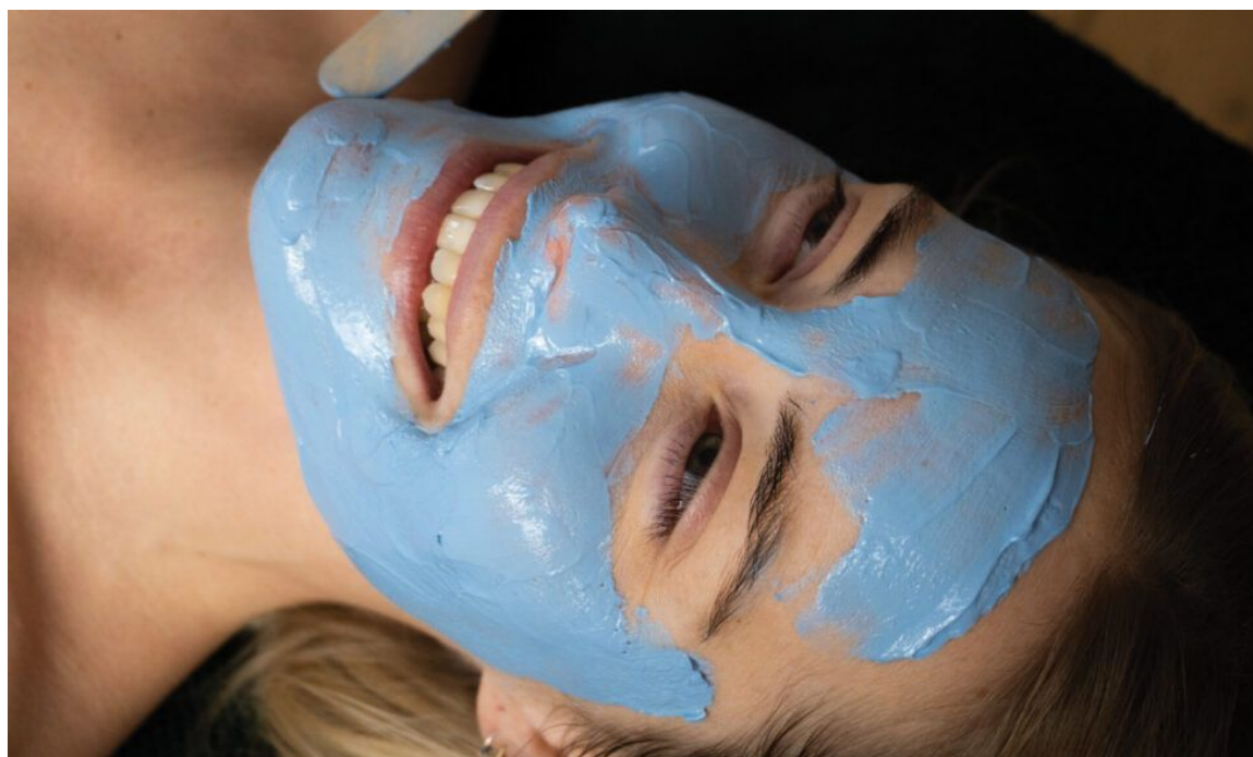
Få glat og flot hud med peeling-behandlingen. Gratis for nye kunder.