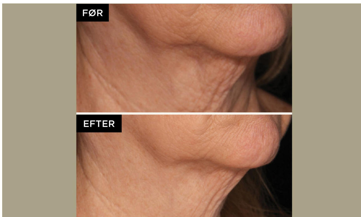
Før- og efterbillede af 1 behandling med Genius af nedre ansigt.