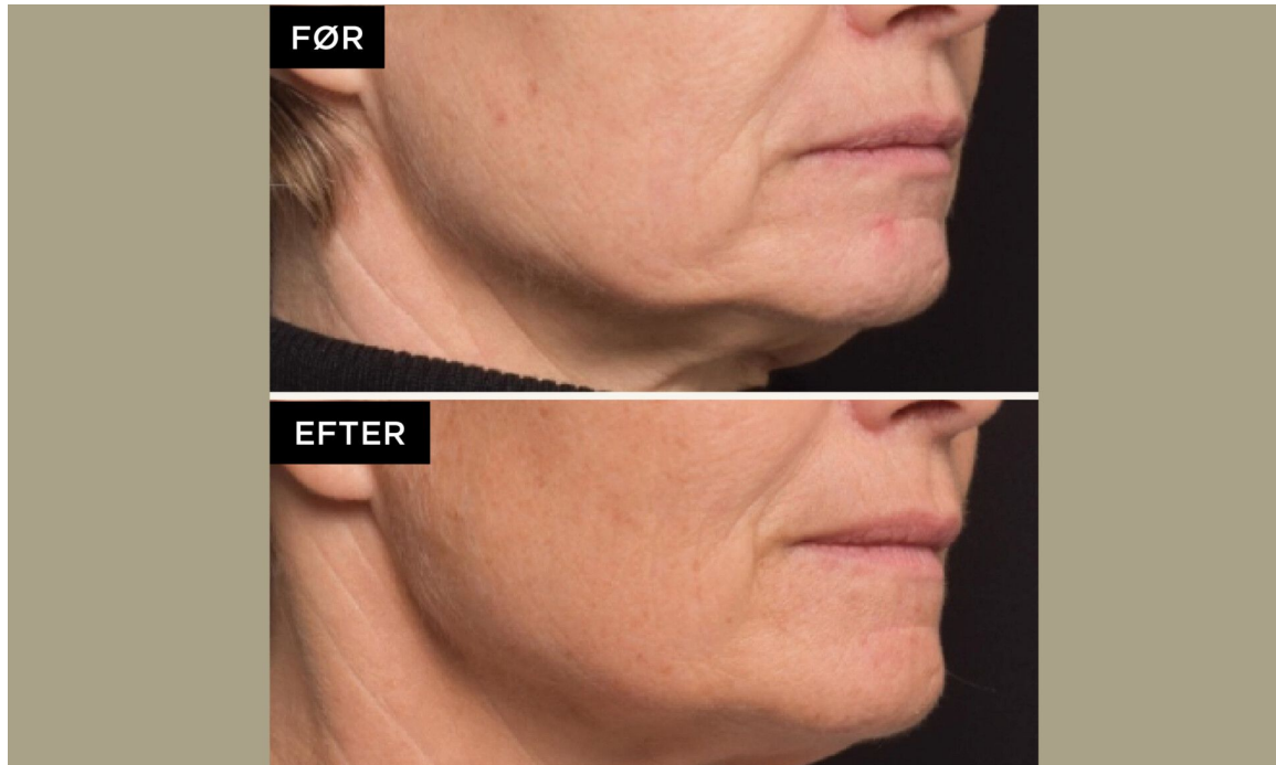
Før- og efterbillede af 1 behandling med Genius af nedre ansigt.

Efter behandlingen kan huden være rød, let tør og hævet i nogle timer. Dog vil den efter et par dage genvinde sin normale tilstand og se fin ud. Det er ikke et nu-og-nu-resultat, men til dig der vil have permanent rynkereduktion og fasthed over tid, da det er en behandling, der kickstarter hudens egen foryngelsesproces. Efter 3-6 måneder vil resultatet være synligt. Antallet af anbefalede behandlinger kan variere afhængigt af hudens alder, kvalitet og ønsket resultat.